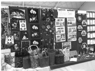
穂積地区文化展・街デイ ほづみの作品たち

ウェブサイト： http://www.hcn.zaq.ne.jp/abiko-h/