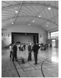
穂積小校区青少年健全育成運動協議会主催の「みんなでやってみよう!」たくさんの子どもたちが学校全体を駆け回り様々なゲームに挑戦!

ただ移行にあたり、地域の皆様以外の市内全域に広がる利用者の皆様にも是非早めに知らせたいことや、同じ部屋を借りても公民館なら800円だったものが、翌日コミセンになると2000円になるとの現状はあまりに急激な値上げになり、そのあたりの激変緩和など、スムーズな移行に向けての取り組みをお願いいたしました。