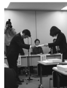
茨木市と市議会 広報紙が近畿市町村コンクールで受賞

まちに出て、いろんな方に出会い、声を掛け合いながら孤立せずに暮らしていきたい、それはどなたも同じだと思います。誰もが笑顔で毎日まちに出られるそんなまちをめざします。