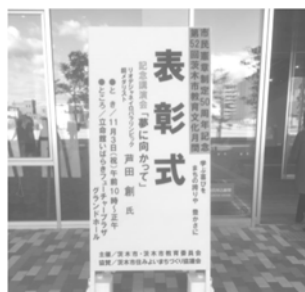
教育月間中央大会

人生にはいい時もあれば悪い時もある。悪い時を今後はどうつないでいくのか?子どもたちの中には悪い結果ばかりが続き、次に向かう気力さえ失ってしまっている子もいます。諦めず何度もチャレンジできる環境をつくること、その為に何から取り組むべきか、私はこのことにチャレンジしていきます。