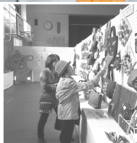
文化展(穂積小体育館)

生活困窮者自立支援事業が立ち上がり、茨木市でも取組が始まっています。子どもの貧困が社会問題として取り上げられるようになり、最近では「子ども食堂」を運営される方も増えてきました。「子ども食堂」に集う子どもたちとの出会いから、家庭全体を支援する取組に繋げるためにCSWの力はとても重要です。CSWが活動しやすい環境づくりを今後とも進めていきます。