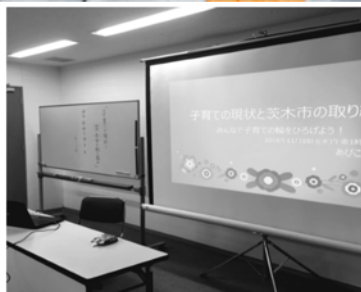
NALKさんでも子育て支援講座

私は子育て中、娘たちが子育てする頃にはもっと楽に、子育てしながら社会参加できるようになっているはずと信じていました。今、次女が大学で学びながら子育てしている様子は、一時預かりを渡り歩きながら、ギリギリ時間をやりくりしながらの毎日です。「女性が輝く社会」と言いながら、結局「家事・育児・介護の現場」は女性の負担が大きいまま、変わっていません。支援制度は20年前よりも進みました。子育てが社会課題として取り上げられるようになりました。しかし制度があっても活用できない、届かない、そんな思いにきちんと答えられているのか？「制度を利用しないあなたが悪い」とまた、母親だけを悪者にしていないか？まだまだ取り組むことはたくさんあります。私はもっと子育て家庭の笑顔のために頑張らねばと思います。