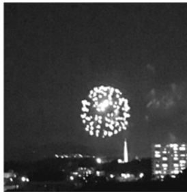
8月8日 弁天さん花火

まだまだ残暑厳しいですが、9月議会に向けて頑張ります！どうぞ皆様もご自愛くださいませ。