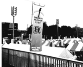
麦音フェストにて

9月に入り、台風の直撃があり、季節がどんどん移り変わっていくのを肌で感じています。朝夕が過ごしやすくなり、あんなに暑い暑い口癖にしていたのに、そろそろ衣替えをしなければと思う今日この頃です。季節の変わり目は体調を崩しやすいですので、どうぞご自愛くださいませ。