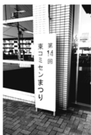
東コミセン祭りにて

淀川右岸水防組合の委員として、奈良県の布目ダムの視察に伺いました。台風21号での水位の調節に苦労したお話を伺いました。淀川水系でも護岸の整備が進んだために今回の台風で大きな被害が無かったことを委員長が報告されていました。本市では安威川の水位は台風時には心配です。現在建設中の安威川ダムが完成すれば、布目ダム同様に大雨の時には水位調節に力を発揮できることでしょう。