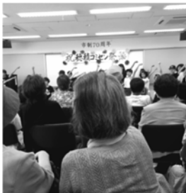
穂積コミセン祭り