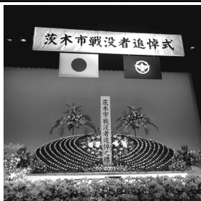
戦没者追悼式にて

週末ごとの台風で地域行事や行楽もなかなか予定通りに進まなかった9月でしたが、10月にはいりようやく週末に秋晴れが続くようになりました。皆さん、お子さん・お孫さんの運動会・地域での運動会では歓声を上げられましたでしょうか？また、種目に参加されたでしょうか？私は腰を痛めてから競技に参加することはなくなりましたが、かつては「一家団欒」と銘打った地区運動会に、夫・私が審判係、招集係、中学生の長女が決勝テープ係、小学生の次女と長男は競技に参加、まさに一家団欒で一日を過ごしたことを思い出します。自治会ごとと一緒にテントの下で食べるお弁当タイムは、自治会・子ども会みんな一緒に輪になってお弁当を食べた楽しい思い出です。子どもの事件が続いていた頃でしたが、地域行事を通して顔の見える関係ができ、地域の方が、顔を知っている子どもたちに声をかけてもらえるようになったらいいなと思っていました。子どもだけではなく、あの時一緒にお弁当を食べた隣のおばちゃんや今日はどうしているのか？そんな思いが災害時に、あの人は？と気付いていける契機につながればと思います。これはあくまでも「そうあればいいな」という想像でしかありません。地域の運動会も高齢化で参加できる方が減り、自治会として負担が大きいというお声もあります。また、ご近所付き合いがしんどくて自治会に入りたくないというお声も聞いています。これから益々高齢化が進みます。そんな時にどんなご近所関係が一番皆さんにとって幸せなことなのか？と考えます。しかし、災害が続いた夏に「人は助け合ってしか生きていけない」と改めて実感いたしました。いざというときに、声を掛け合えること、助け合えること、分け合えること、助けてほしいという声をあげられること、受け止められること、それは「災害時のマニュアルを作りました」というだけでは真価を発揮しないのではと思います。結局最後は『人』なのでないでしょうか。