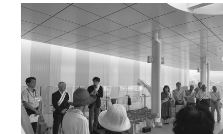
社会を明るくする運動（7.1）JR茨木