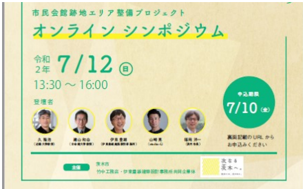
オンライン シンポジウムちらし

申請期間(オンライン申請、郵送申請共通)8月18日(火曜日)まで(郵送は当日消印有効) ※特別定額給付金コールセンター 電話 072-655-2759