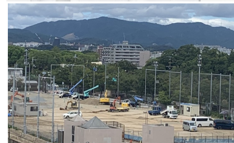
工事が進む北グランド