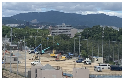
工事が進む北グランド