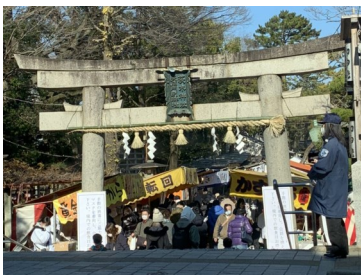
元旦の茨木神社 (中には入らなかったです)

1月13日(水)に茨木市は民生常任協議会を招集し市長の専決処分の説明を行います。国の説明では2月より新型コロナウイルスワクチンの接種が医療従事者から開始される予定です。その後65歳以上の高齢者から順次接種が行われます。接種は住民票のある居住地で行われることから、接種の準備として事務費の予算を3月議会を待たずに市長の7専決処分を行います。ワクチン接種のための接種券(クーポン)の印刷・郵送、接種場所の確保など準備が必要です。(裏面にスケジュール掲載) ※厚生労働省説明資料より