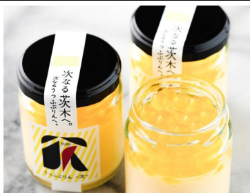
次なる茨木うっふびりん

1月24日(日)執行の茨木市議会議員一般選挙におきまして3223票をいただき、当選いたしました。皆様のご支援に心より感謝申し上げます。おかげさまで5期目へ再スタートを切ることができました。皆様からいただきました信託を真摯に受け止め「まっすぐに、ひたむきに」活動をして参ります。今後ともよろしくお願いたします。