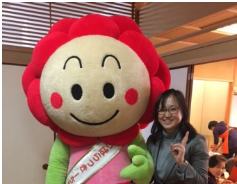
いばらっきーちゃんと