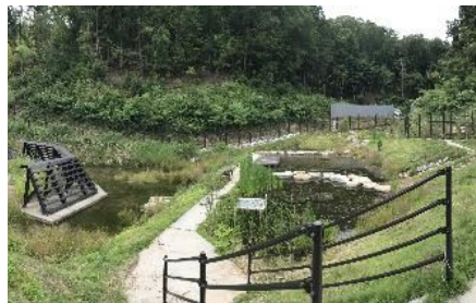
千提寺地区ピオトープ