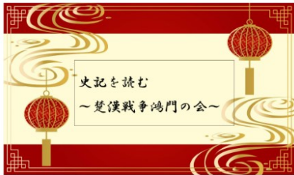
史記を読む 3/5きらめき