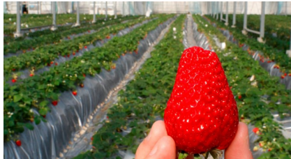
寺田農園のいちご 裏面掲載・いちごツアー