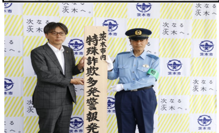
特殊詐欺多発警報発令中です

緩やかな増加傾向で、5類移行後も4週連続で増加が続いていて、地域別では36の都道府県で前の週より増え、沖縄県では感染拡大の傾向がみられるとしています。