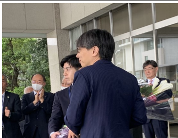
4月18日福岡市長の初登頂にて