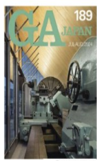
GA JAPAN 189号