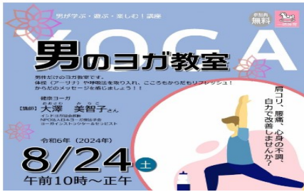
男のヨガ洋室 8/24 ローズWAM