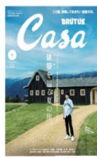
Casa BRUTUS 2024年8月号