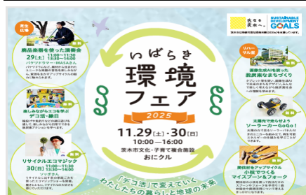
いばらき環境フェア 11/29・30